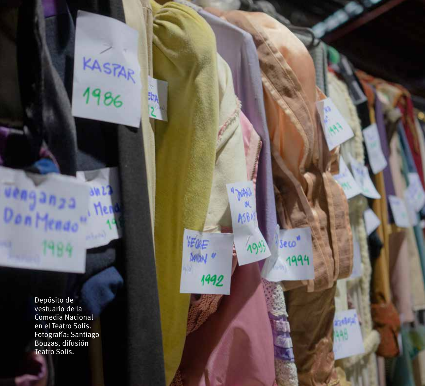
Depósito de vestuario de la Comedia Nacional en el Teatro Solís.