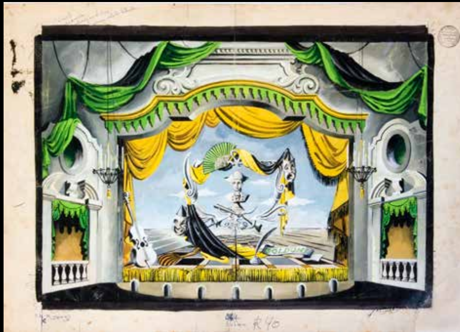
Escenografía realizada por José Echave.